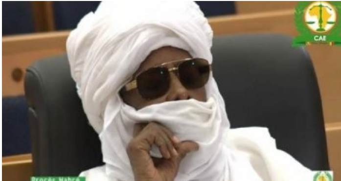
Hissène Habré

Le séminaire s'appuiera sur l'élan actuel lancé par le procès d'Habré afin de promouvoir la responsabilité et de mettre fin à l'impunité des crimes atroces. Le but de ce séminaire est d'apporter les leçons du procès Habré aux acteurs nationaux et régionaux en Afrique, renforçant ainsi les capacités en matière de justice pénale internationale.